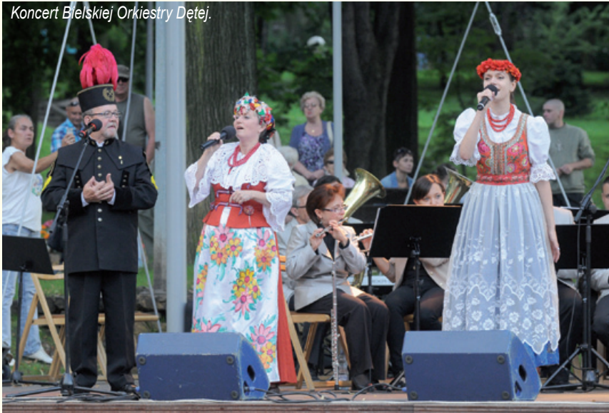
Koncert Bielskiej Orkiestry Dętej.