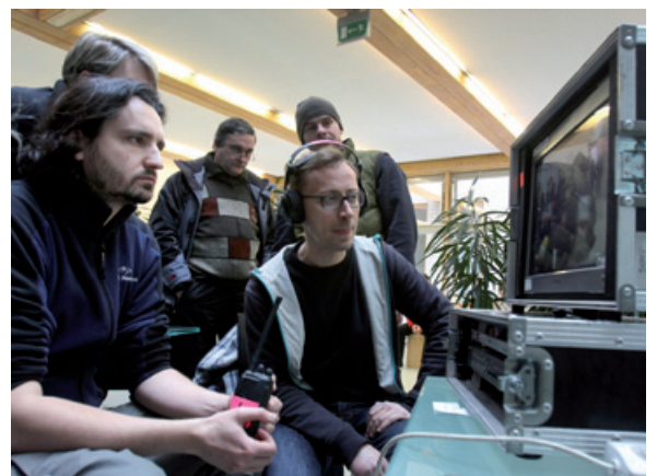
Realizatorzy Kreta w trakcie pracy nad filmem.